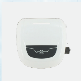
Unidad de control