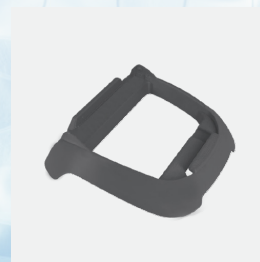
Soporte para unidad de control