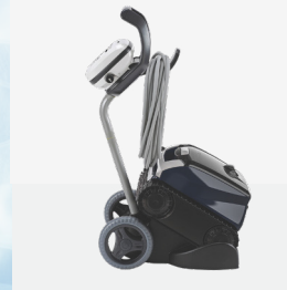
Carro de transporte