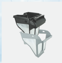
Filtro rectangular(4L ) Doble nivel