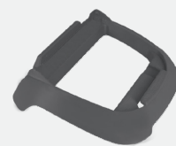
Soporte para unidad de control