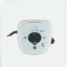
Unidad de control