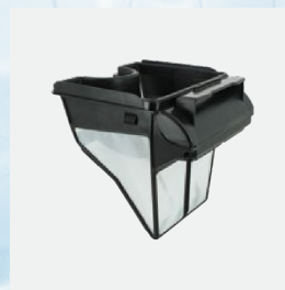
Doble filtro(4L) 526 cm 2