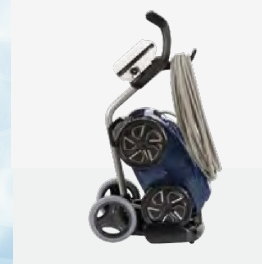
Carro de transporte