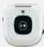
Unidad de control