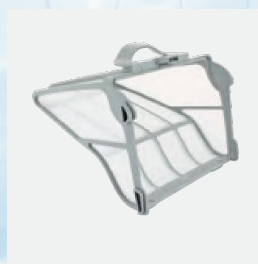
Filtro rectangular(5 L)