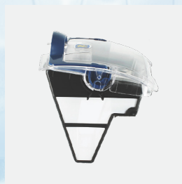
Filtro (3L) de fácil acceso