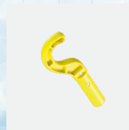
Gancho universal para facilitar la salida de agua