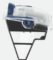
Filtro (4L) de fácil acceso