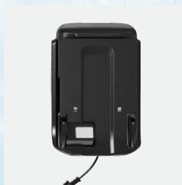
Estación de carga y almacenamiento