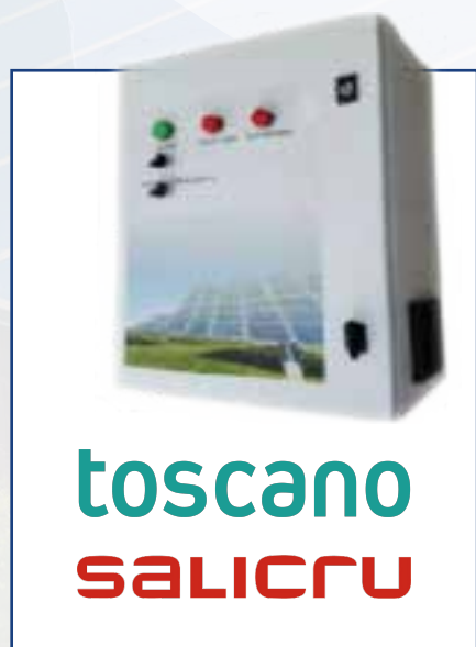
Cuadros de bombeo